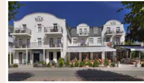
Unser kleines Juwel am Lindenpark, das 4 Sterne Boutique Hotel.