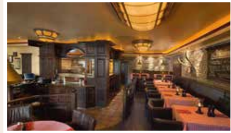
Steak Combos, Special Cuts, Burger und Ribs vom Lavastein Grill.