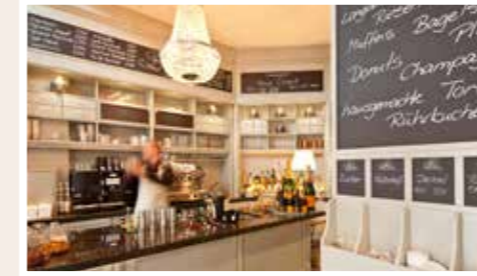
Kaffee und Kuchen mit Meerblick im Jugendstil Turm.