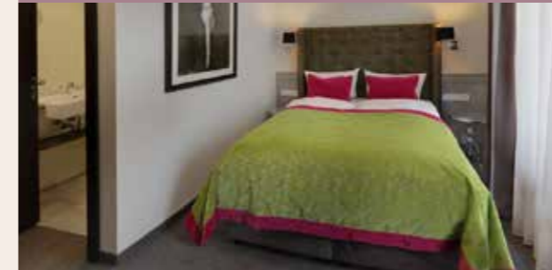
Unsere Standard Kategorie, wertig eingerichtet und ruhig gelegen. Ca. 17 m 2 . Belegung max. 2 Personen