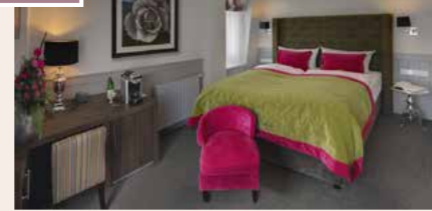
Unsere größten Zimmer, mit maximalem Komfort. Ca. 20 m 2 . Belegung mit max. 3 Personen möglich.

Deluxe Park View Doppelzimmer mit Balkon Deluxe Boutique Doppelzimmer