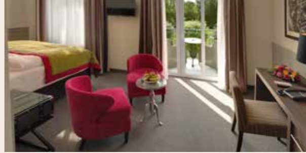
Unsere Premium Kategorie. Zur Südseite gelegen, mit Blick auf den Lindenpark. Ca. 17 m 2 . Belegung max. 2 Personen.