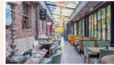
Französische Klassiker und jetzt neu mit Seafood, Sushi & Oyster Bar.