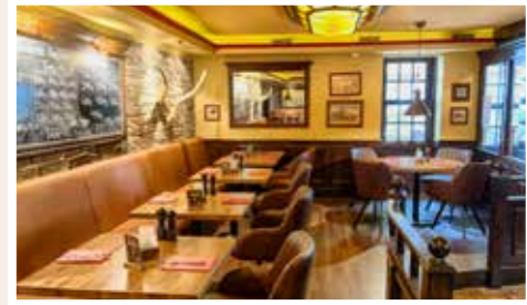
Steak Combos, Special Cuts, Burger und Ribs vom Lavastein Grill.