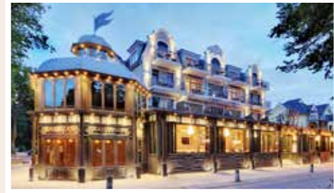
Der große Bruder, das 4 Sterne Superior Belle Epoque Strandhotel direkt an der Ostseeallee.