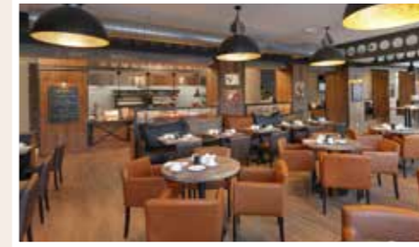
Unsere Rotisserie mit Geflügel Spezialitäten, BBQ Spießen, Burgern, Steaks & Turkey Legs, mit Showküche, Lavastein Grill & großer Terrasse.