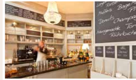
Kaffee und Kuchen mit Meerblick im Jugendstil Turm.