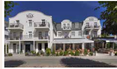
Unser kleines Juwel am Lindenpark, das 4 Sterne Boutique Hotel.