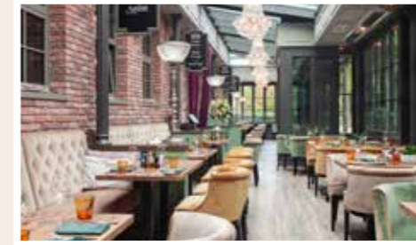
Französische Klassiker und Seafood, Sushi & Oyster Bar.