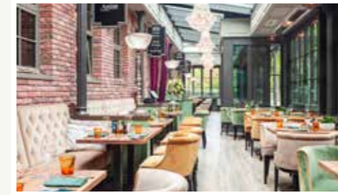
Französische Klassiker und Seafood, Sushi & Oyster Bar.