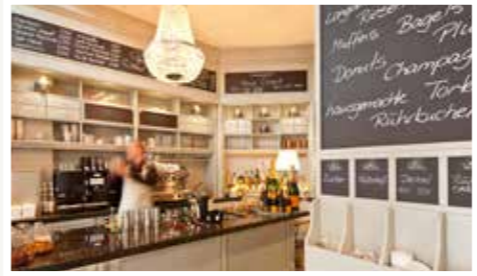
Kaffee und Kuchen mit Meerblick im Jugendstil Turm.