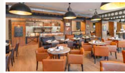
Unsere Rotisserie mit Geflügel Spezialitäten, BBQ Spießern, Burgern, Steaks & Turkey Legs, mit Showküche, Lavastein Grill & großer Terrasse.