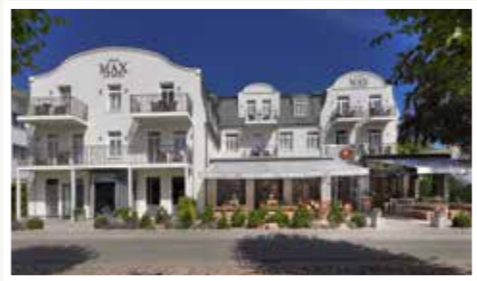
Unser kleines Juwel am Lindenpark, das 4 Sterne Boutique Hotel.